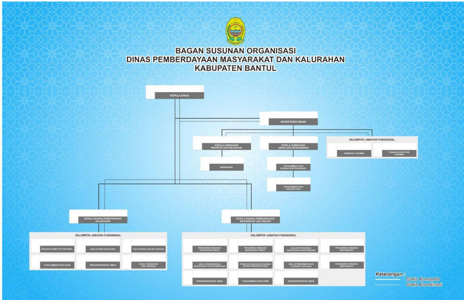
Gambar 2.1 Bagan struktur organisasi Dinas Pemberdayaan Masyarakat dan Kalurahan